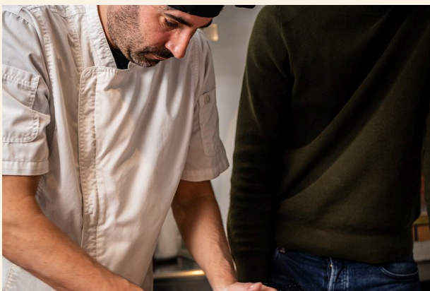
Zelf doen — vers deeg onder begeleiding

Eén zaterdag per maand sta je in onze kookstudio met houtoven. De kookgroep kookt de gerechten van het blok, de wijngroep proeft de bijbehorende wijnen, en tijdens de didactische lunch komt alles samen. Tussen de lesdagen leer je online verder met instructievideo's, wekelijkse Zoom-sessies en opdrachten die je thuis uitvoert.