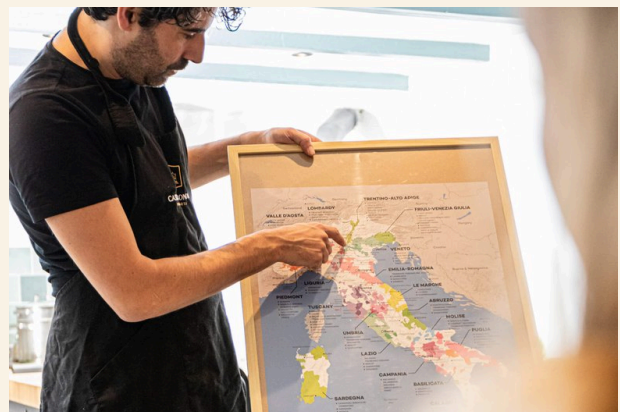
Proeven & begrijpen — de wijnstreken