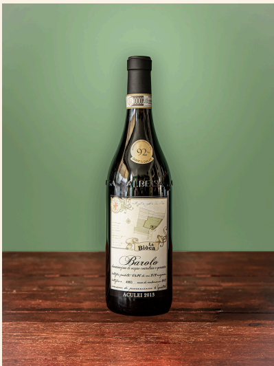
Barolo — La Bioca, Piemonte

Van Nebbiolo uit de Langhe tot Etna-wijnen van vulkanische bodem: elk blok brengt je dichterbij de bron.