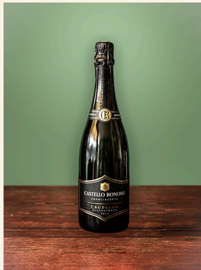
Franciacorta — Castello Bonomi