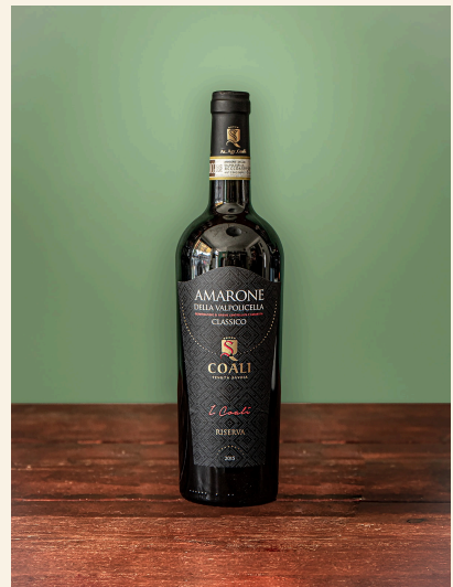
Amarone — Coali, Veneto